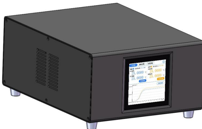
HTC 双路温控仪产品图 (产品功能有迭代, 请以实物为准)